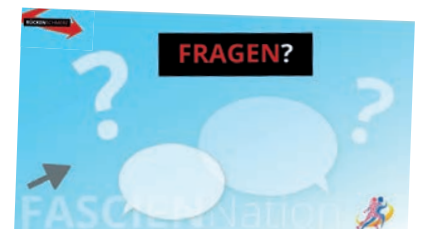
Auszüge der Präsentation